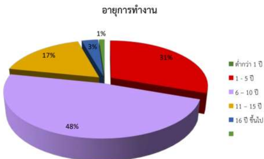
แผนภูมิ แสดงจำนวนบุคลากร จำแนกตามอายุการทำงาน ปีการศึกษา 2562

จากแผนภูมิ แสดงจำนวนบุคลากร จำแนกตามอายุการทำงาน ปีการศึกษา 2562 พบว่า มีช่วงอายุการทำงาน มากที่สุด คือ ช่วงอายุการทำงาน 6-10 ปี ร้อยละ 48 รองลงมา คือ อายุการทำงาน 1-5 ปี ร้อยละ 31 และอายุการทำงานน้อยที่สุด คือ 16 ปีขึ้นไป ร้อยละ 1